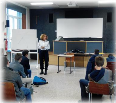
Intervention Police Nationale